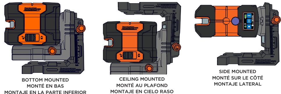
Figure 2 Figure 2 Figura 2

2.5" TRAVEL COURSE DE 64 MM DESPLAZAMIENTO DE 64 MM